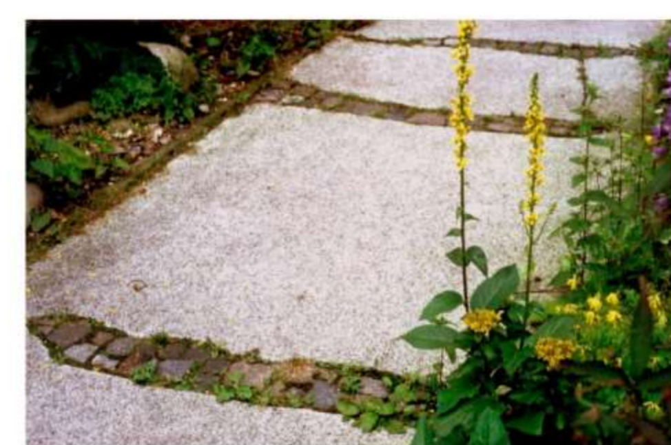
Detail Betonfläche Großformatige Platten ergänzt mit Kleinstpflaster